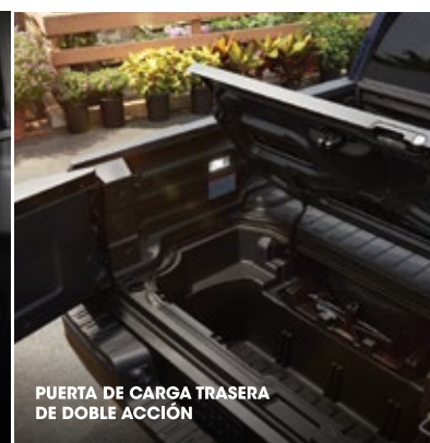
PUERTA DE CARGA TRASERA DE DOBLE ACCIÓN