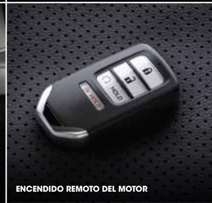
ENCENDIDO REMOTO DEL MOTOR