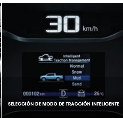
SELECCIÓN DE MODO DE TRACCIÓN INTELIGENTE