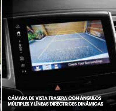
CÁMARA DE VISTA TRASERA CON ÁNGULOS MÚLTIPLES Y LÍNEAS DIRECTRICES DINÁMICAS