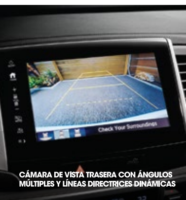
CÁMARA DE VISTA TRASERA CON ÁNGULOS MÚLTIPLES Y LÍNEAS DIRECTRICES DINÁMICAS