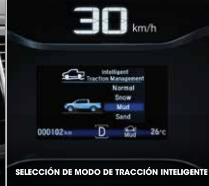
SELECCIÓN DE MODO DE TRACCIÓN INTELIGENTE