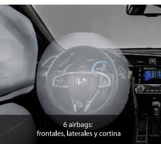
6 airbags: frontales, laterales y cortina