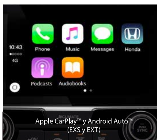
Apple CarPlay™ y Android Auto™ (EXS y EXT)