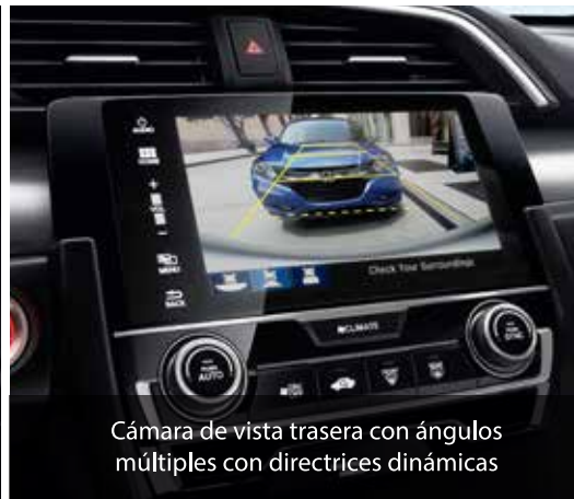
Cámara de vista trasera con ángulos múltiples con directrices dinámicas