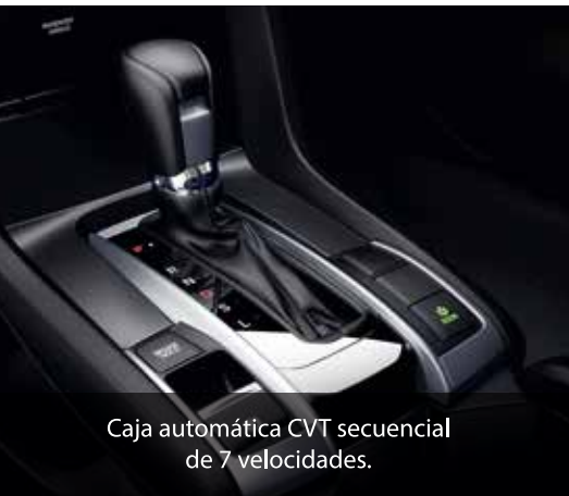
Caja automática CVT secuencial de 7 velocidades.