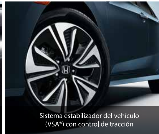
Sistema estabilizador del vehículo (VSA®) con control de tracción